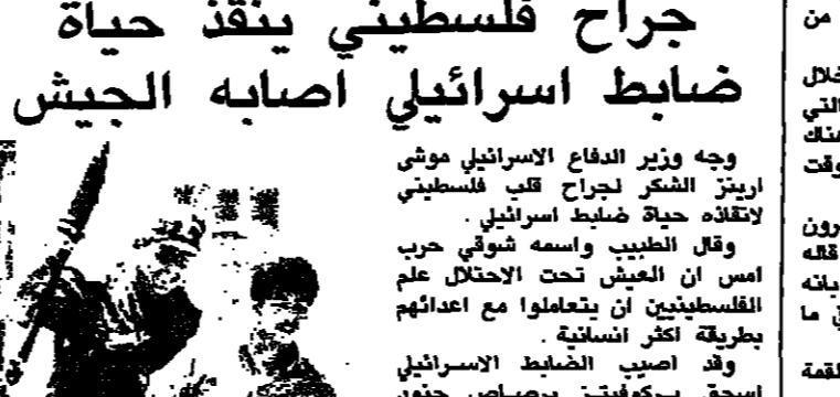
كابتن اسرائيل يركل شابا فلسطينيا